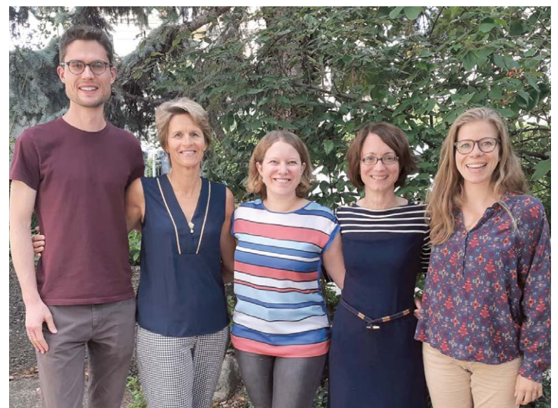
L'équipe IAESTE Switzerland 2019