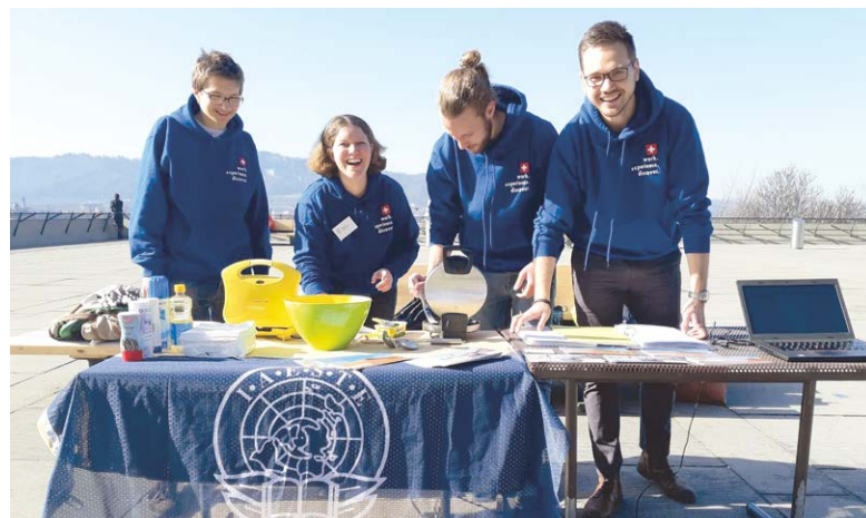
Le stand de gaufres de l'IAESTE sur la Polyterrasse de l'EPF Zurich

de quatre universités ainsi que lors d'autres manifestations, par exemple avec un stand de gaufres sur la Polyterrasse de l'EPFZ. L'équipe a été efficacement soutenue dans ces activités par les membres des comités locaux qui ont souvent pu parler de leurs propres expériences avec l'IAESTE. Cette aide nous est très précieuse, car nous constatons depuis des années que le besoin d'information des étudiants s'accroît de plus en plus. Le nombre de questions augmente et il faut surmonter des incertitudes et des craintes toujours plus grandes avant qu'un étudiant d'aujourd'hui opte définitivement pour un stage à l'étranger.