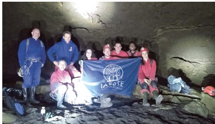
IAESTE s'aventure dans le Hölloch

Lors d'une expédition de huit heures dans les profondeurs du Hölloch, un groupe de neuf stagiaires en a appris beaucoup sur l'eau de fonte, l'esprit d'équipe et l'histoire de ce système de grottes de plus de 200 km de longueur.