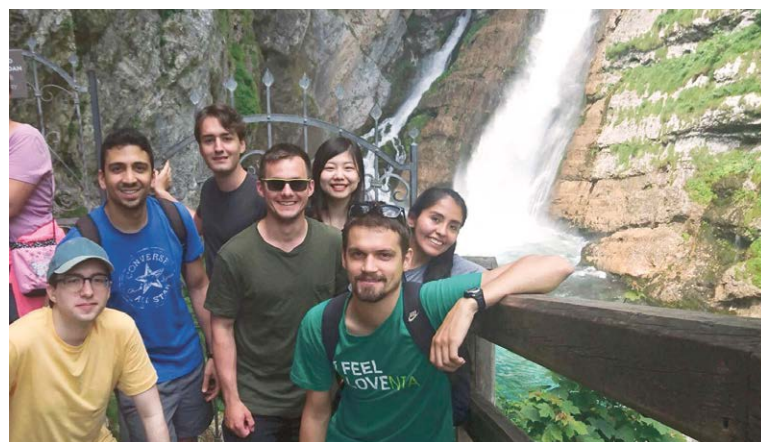
Les stagiaires de Ljubljana font connaissance lors du premier événement de week-end

À mon arrivée à Ljubljana, j'ai pleinement bénéficié du tutorat et du service de recherche de logement de l'IAESTE: J'ai été accueilli à la gare, et ma carte de transport en commun, ma carte SIM, mon logement et l'enregistrement étaient déjà organisés; j'ai pu entre-temps nouer des contacts avec mes voisins et attendre mon premier jour de travail avec impatience. Le premier week-end d'excursion a rapidement été organisé avec d'autres stagiaires sur le chat de groupe.